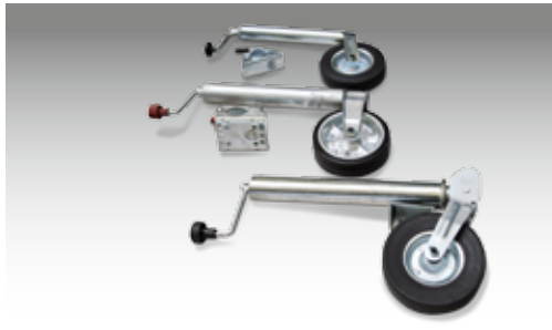
Stützrad (Ausführung je nach Modell)