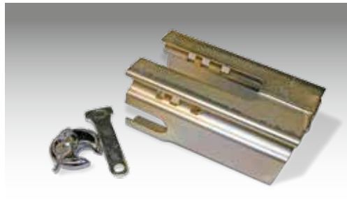
Metall-Absperrschuh mit Schloss