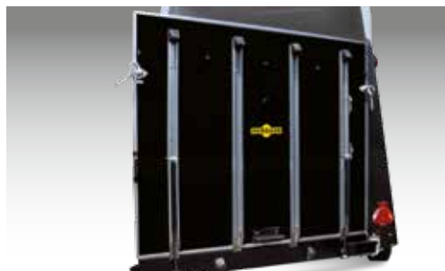
Hecktüre dreh- und schwenkbar (HTV 243016)