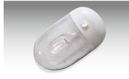
Innenraumleuchte im Viehanhänger