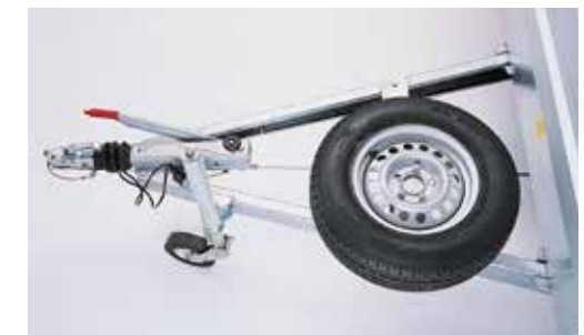
Ersatzradhalter auf Deichsel montiert (nur bei langer Zugdeichsel möglich)