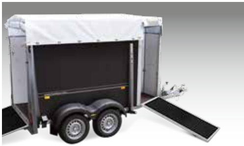
Frontausstieg in Fahrtrichtung, links/rechts zusätzlich