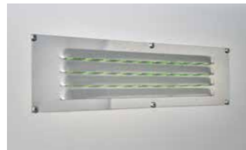
Lüftungsschieber 410x100 mm