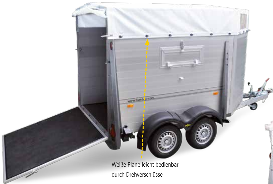
Weißer Plane leicht bedienbar durch Drehverschlüsse