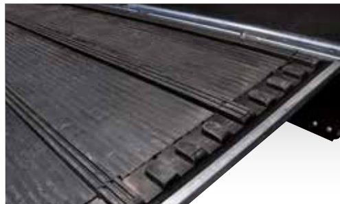
Heckklappe mit Trittleistengummi (HTV 243016)