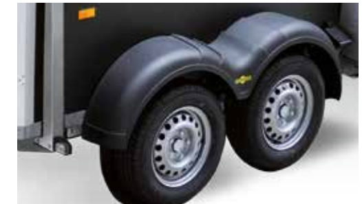
Bereifung 185/65 R14 anstatt 13 Zoll