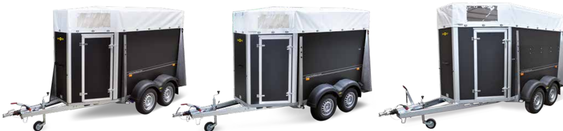
Tandemachser Plywood HTV 163114