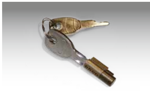
Steckschloss für ungebremste Anhänger