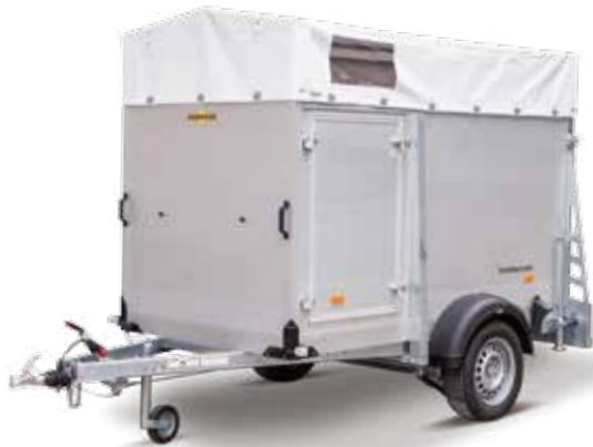
Einachser Alu HEV 132513/152513

Der neue wendige Einachs-Viehanhänger besticht durch einen robusten Aufbau aus doppelwandigen eloxierten Aluminiumprofilen, die an einem massiven Außenrahmen aus feuerverzinktem Stahl befestigt sind. Sein Fahrwerk bietet durch sein feuerverzinktes Fahrgestell eine hohe Stabilität und dadurch beste Sicherheit. Für einen sicheren Stand während der Fahrt sorgt der verklebte und versiegelte Gummiboden. Eine große Einstiegstür befindet sich auf der linken Seite des Anhängers. Der Anhänger ist mit einer robusten Plane und Spiegel ausgestattet.