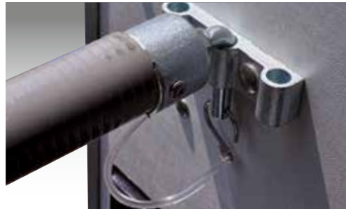
Bruststange/Heckstange 3 x längsverstellbar (HTV 243016)