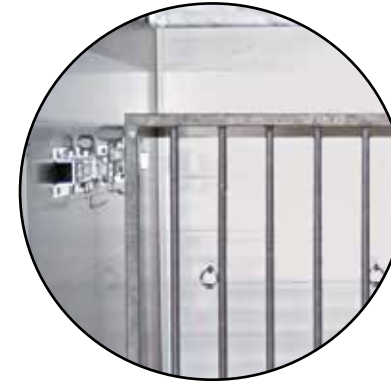
Trenngitter (optional) individuell verstell- und schwenkbar