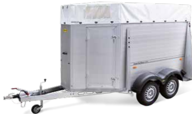
Tandemachser Alu HTV 203217 AS

Der neue wendige Einachs-Viehanhänger besticht durch einen robusten Aufbau aus doppelwandigen eloxierten Aluminiumprofilen, die an einem massiven Außenrahmen aus feuerverzinktem Stahl befestigt sind. Sein Fahrwerk bietet durch sein feuerverzinktes Fahrgestell eine hohe Stabilität und dadurch beste Sicherheit. Für einen sicheren Stand während der Fahrt sorgt der verklebte und versiegelte Gummiboden. Eine große Einstiegstür befindet sich auf der linken Seite des Anhängers. Der Anhänger ist mit einer robusten Plane und Spiegel ausgestattet.