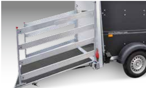
Beidseitiges Treibgitter an Auflaufklappe