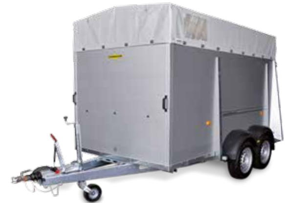
Tandemachser Alu HTV 243016 AG

Alle Einfassungen und Seitenwände bestehen aus hochwertigen eloxierten Aluminiumprofilen. Für sicheren Stand während der Fahrt sorgt der witterungsbeständige Plywood-Boden, der mehrfach wasserfest verleimt und rutschhemmend ist. Jeweils über eine Einstiegstür an der Seitenwand kommen sie jederzeit bequem in den Innenraum. Die Anhänger sind mit robuster Plane und Spiegel ausgestattet.