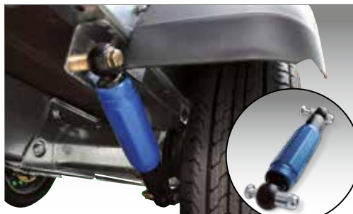
Radstoßdämpfer (montiert) inkl. 100 km/h Bestätigung Radstoßdämpfer (lose) ohne 100 km/h Bestätigung