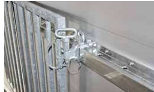
Trenngitter quer verstell- und schwenkbar